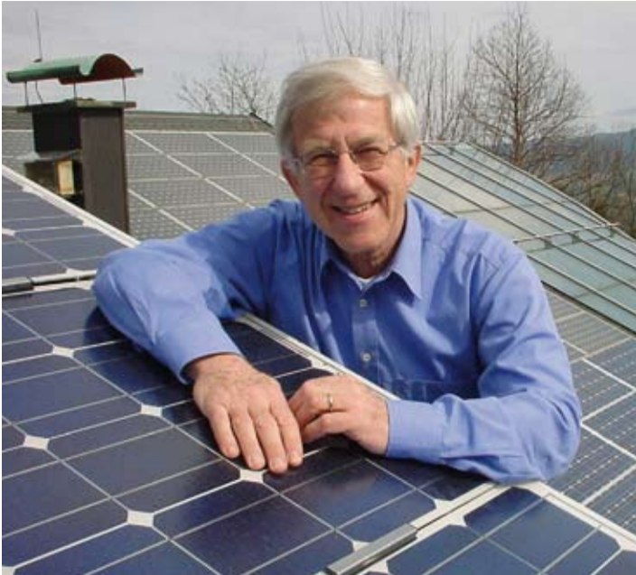
Franz Alt aus Baden-Baden leitete und moderierte u. a. das Magazin „Report Baden-Baden“. Der engagierte Grimme-Preisträger schreibt regelmäßig zeitkritische Gastkommentare und Hintergrundberichte. Er betreibt auch die ausgezeichnete Webseite www.sonnenseite.com

Quelle: „Der Freitag“ vom 3.10.2010 · Mit freundlicher Genehmigung des Autors Franz Alt